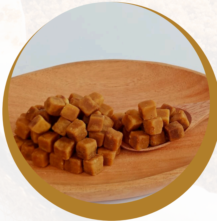
Coconut Sugar Cube