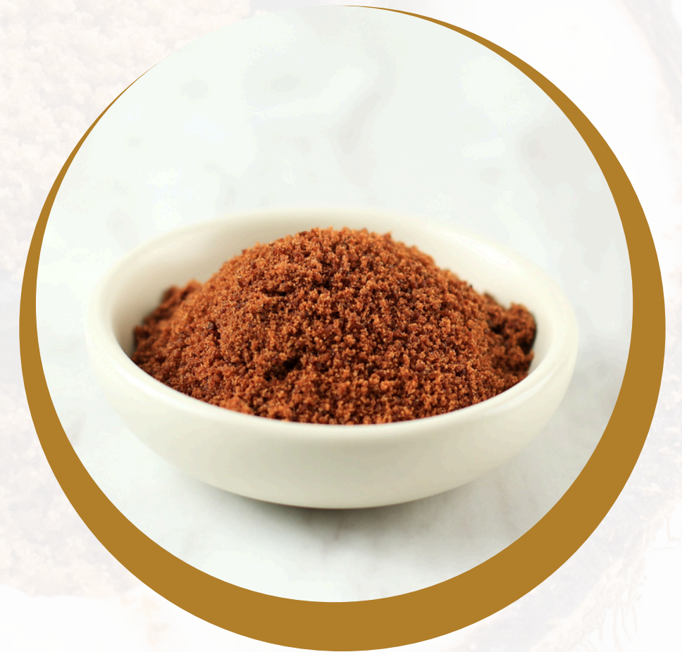
Coconut Sugar Powder